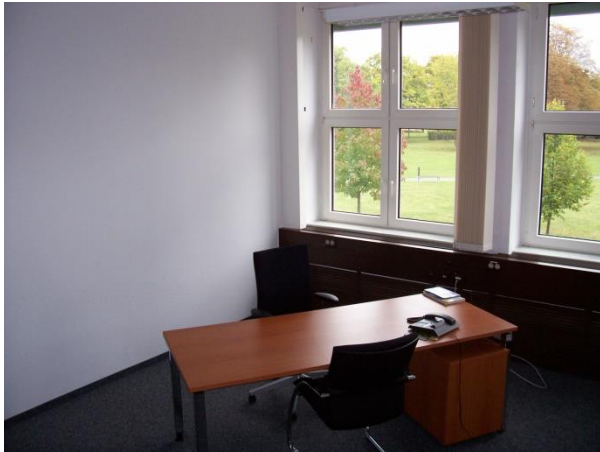
Büroraum 123, 1. OG, 21,87 m²