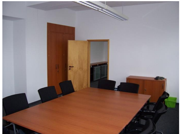
Konferenzraum 124, 1. OG, 33,75 m² mit Durchgang zum Büro