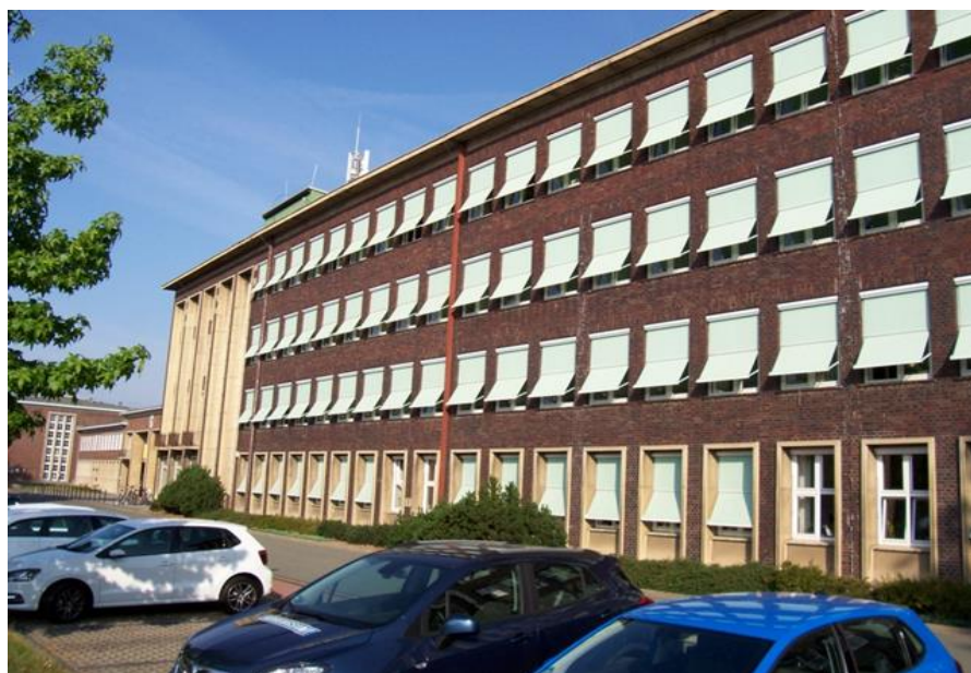
Südseite des Verwaltungszentrums mit PKW-Stellflächen