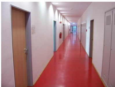
Flur zu den Büros