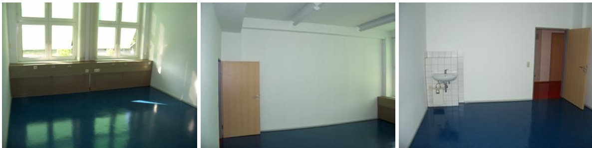
Einzelbüros Zimmer 221 (im Plan mit gelber Farbe gekennzeichnet)