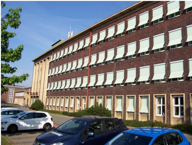
Südseite des Verwaltungszentrums mit PKW-Stellflächen