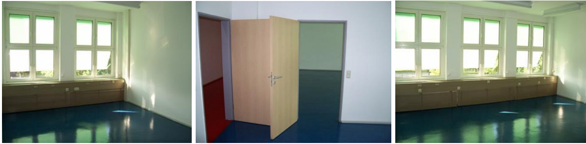
Büroraumkombination Zimmer 227/228 (im Plan mit brauner Farbe gekennzeichnet)